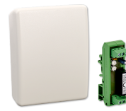
LTM TL CO2