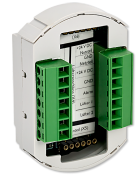
LTM TL MODULE AC 1230-AC 200-50