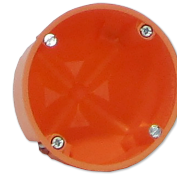
LTM TL HWD